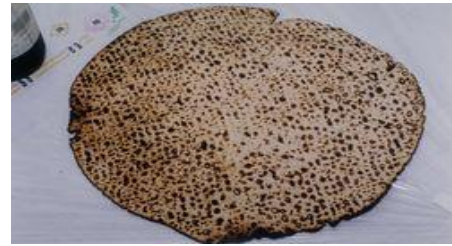
Mkate Usiotiwa Chachu