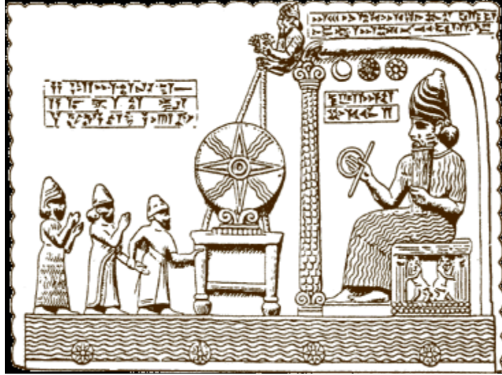
牧師的太陽標誌，沙馬什前祈禱

印度教徒，佛教徒，穆斯林和其他遵循類似的古巴比倫人的做法。既然上帝不希望被崇拜異教的神被崇拜（申命記12：29-31），緊握的雙手似乎不適合基督徒。