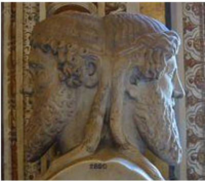
羅馬神杰納斯比夫龍在梵蒂岡博物館