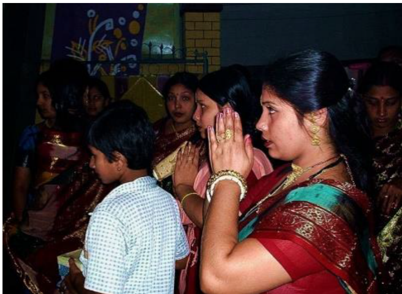
印度教徒祈禱女神杜爾迦（由哈桑·伊克巴爾）

印度教徒，佛教徒，穆斯林和其他遵循類似的古巴比倫人的做法。既然上帝不希望被崇拜異教的神被崇拜（申命記12：29-31），緊握的雙手似乎不適合基督徒。