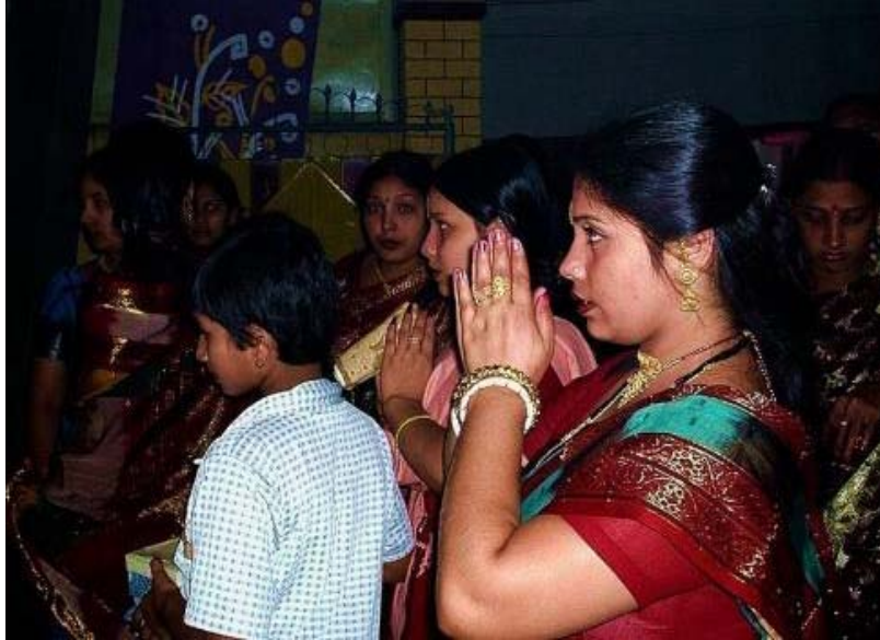
ההינדים מתפללים לאלה דורגה (על ידי חסן איקבל ומי)

ככל עמדות אחרות ללכת, כמה אנשים, בגלל חולשה פיזית, לא יכולים לכרוע או אפילו לעמוד. היכולת של אלוהים כדי לשמוע ולענות על תפילות אינה מוגבלת על ידי נסיבות כאלה.