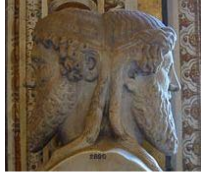
אלוהים הרומי יאנוס ביפרונש במוזיאון הוותיקן